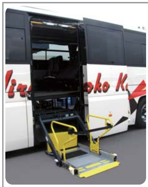
■中央スイングドアからの昇降

ガーラならではの優雅な空間で、車いすのお客様にもゆったりとした旅を楽しんでいただけます。