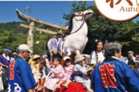
子どもの誕生と健やかな成長を願って街中で八朔の馬(台車にのせた馬の模型)を引き回します。