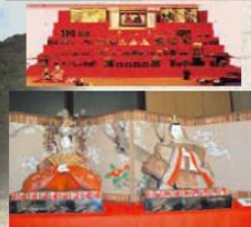
鞆の浦の町中が雛人形一色に、各町家に代々伝わる雛飾りを公開。