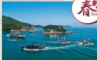
約380年の伝統を誇る漁法。船団を組んで桜鯛の群れを一網打尽にします。その華麗さ、勇壮さには目をみはるものがあります。