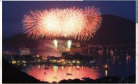
弁天島をバックに海上に映える美しい光のファンタジー

■お手火神事(おてひんし)・・・7月 夏祭・神楽渡御の前夜に行われ町内の清祓、無病息災を祈る火祭。福山市無形民俗文化財。