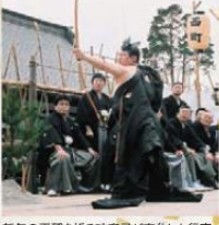
新年の平穏を祈る破魔弓が変化した行事。福山市無形民俗文化財に指定されています。